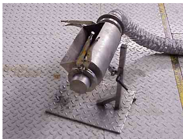
Der Auffangtrichter wird bei der Konditionierung eines Fahrzeugs an den Auspuff gestellt, um die Abgas abzusaugen.