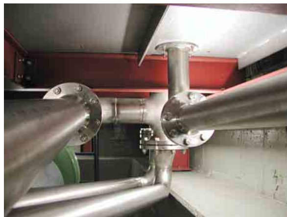
Unterflurverrohrung: Von den Buchsen im Boden des Prüfstandes hat Bleyer Edelstahl-Rohre zu den Abgas-Messanlagen verlegt.