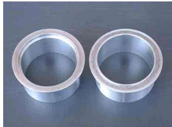
Die Anschluss-Stücke sind nach dem Prinzip von Stecker und Buchse geformt, die Dichtung aus Graphit ist hochtemperaturfest.