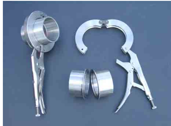
Die geschlossene Klemmzange (links) hält zwei Anschluss-Stücke zusammen. Rechts die offene Zange und Anschluss-Stücke.

Die Anschluss-Stücke werden aus Edelstahl Rostfrei® hergestellt. Die verwendeten Materialien sowie die Verarbeitung der gesamten Klemmzange gewährleisten eine hohe Robustheit und Langlebigkeit.