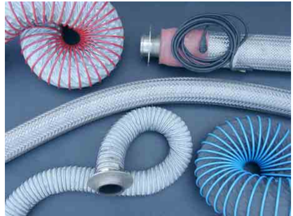
Unterschiedliche Ausführungen: Edelstahl-Schläuche, beheizt und unbeheizt, sowie Teflon-Schläuche mit Stahlspirale.

Kompensatoren bzw. Metallbälge auf der Basis von Ringwellschläuchen sind elastisch und nehmen dadurch Bewegungen und Spannungen innerhalb einer starren Verrohrung auf. Dabei kommt es nicht zu Druckverlusten. Undichtigkeiten durch Verkanten oder Achsversatz werden ebenso vermieden. Bleyer liefert die Kompensatoren in jeder Länge, gerne auch mit Anschluss-Stücken.