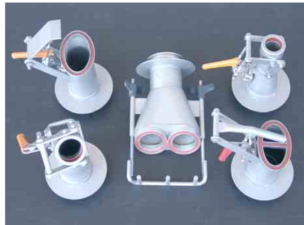
Unterschiedliche Auspuffquerschnitte benötigen kreative Konstruktionen. Gute Bedienbarkeit steht dabei immer im Vordergrund.