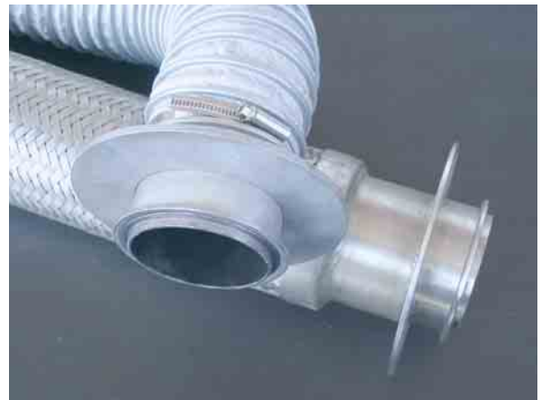
Das Anschluss-Stück ist an einen Metallschlauch geschweißt bzw. mit einer Schelle an einen Teflonschlauch geklemmt.