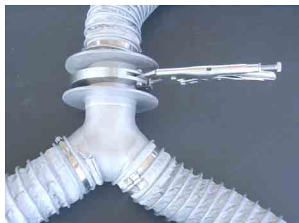
Die Anschluss-Stücke werden an die Teflonschläuche geklemmt, größere Metallringe dienen als Schlagschutz für den Flansch.