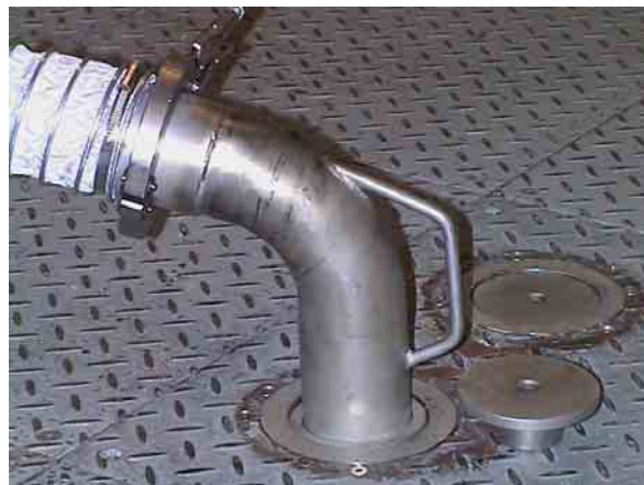
Adapter, der den Abgasabführungsschlauch über die Buchse mit der Unterflurverrohrung verbindet.

Der Abgas-Auffangtrichter ist von der S. Bleyer GmbH speziell für die Konditionierung entwickelt worden: Der Auffangtrichter wird an den Auspuff gestellt. An einer Seite wird ein Teflonschlauch angeschlossen, der über die Unterflurverrohrung zum Kamin des Prüfraums führt. So wird das Abgas während der Konditionierung abgesaugt.