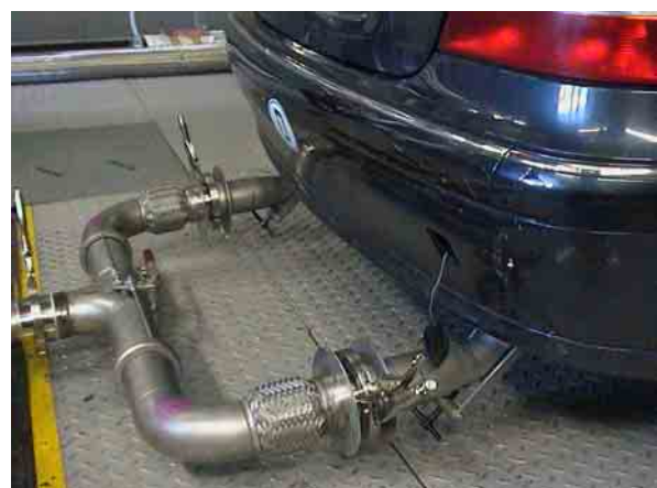
Für Pkw mit doppelflutiger Auspuffanlage konstruierten die Bleyer-Mitarbeiter dieses in der Breite variable „Elch-Geweih“.