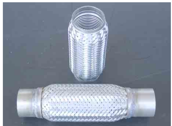
Ringwellschlauch-Kompensatoren mit Edelstahl-Gewebe reduzieren axiale, angulare und laterale Schwingungen.