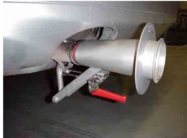
Abgasabführungsadapter am Auspuff eines Fahrzeugs. Mit dem roten Hebel wird der Adapter gasdicht am Auspuffrohr befestigt.

Die Abgasabführungsadapter sind zertifizierungskonform und können somit für alle Abgasmessungen eingesetzt werden.